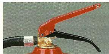
Abb. 1 Wandhalter serienmässig Abb. 2 Schlauchhalterung im Fussring integriert Abb. 3 Ventilarmatur mit Tragegriff und Betätigungshebel