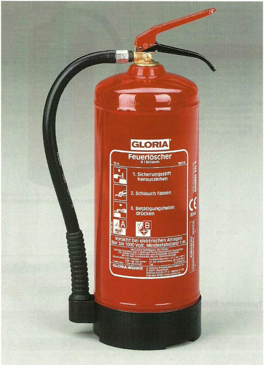
Abb. S 6 DLWB